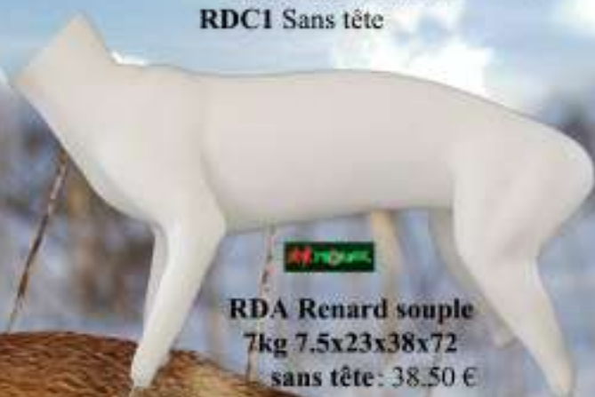
RDA Renard souple 7kg 7.5x23x38x72 sans tête: 38.50 €