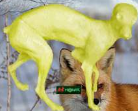
RDC Renard rigide 6kg 7.5x23x38x65 Avec tête : 40.50 € RDC1 Sans tête