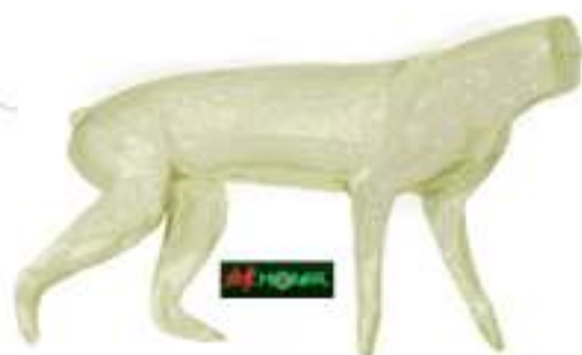
RDA2 Renard souple sans tête 6kg 6.5x22x36x68 : 33.50 €