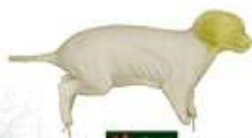
RDF Renardeau souple avec tête rigide 1.5kg 4x17x26x37: 25 €