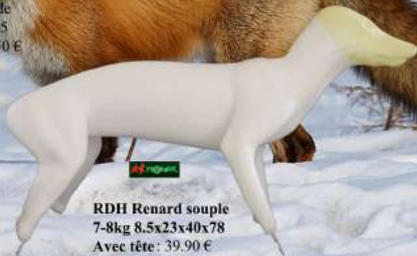
RDH Renard souple 7-8kg 8.5x23x40x78 Avec tête: 39.90 € RDH1 Sans tête