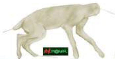
RDG Renardeau souple sans tête 3kg 5x17x28x50: 27.50 €