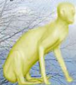
RDD Renardeau rigide avec tête 4kg 6.5x19x33x60 : 34.50 €