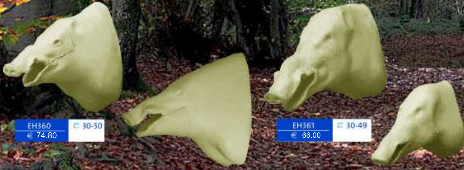
EH360 € 74.80 30-50 EH361 € 66.00 30-49 EH360XL € 77.00 30-50 EH362 € 57.20 29-45