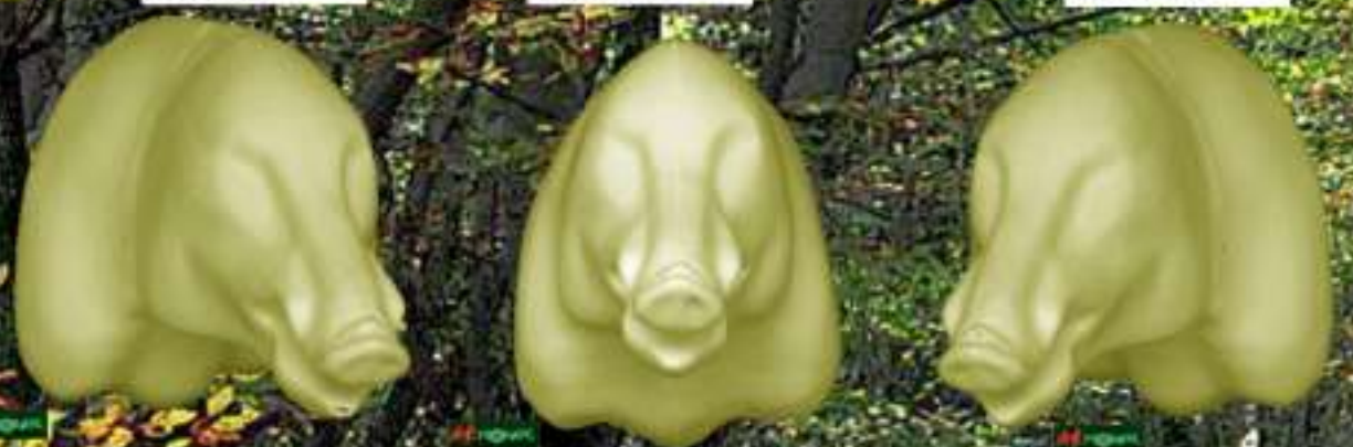
SGRD 23X79 DR : 45.10€ SGR 23X79 DR : 45.10€ SGRG 23X79 DR : 45.10€