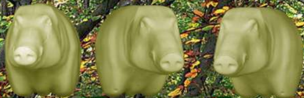
SGD 80/90KG 24X64 DF: 42.90€ SGDD 80/90KG 24X64 DR: 42.90€ SGDG 80/90KG 24X64 GA: 42.90€