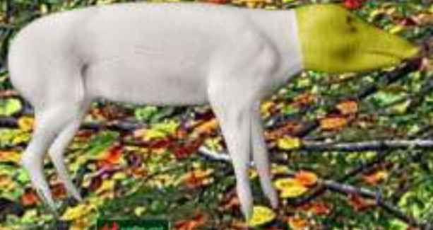
SGM Marcassin souple tête rigide 25 kg 12/36/82/84 : 108.90€