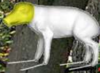
SGJ Marcassin souple tête rigide 2.5 kg 7.5/22/31/46 : 31.35€