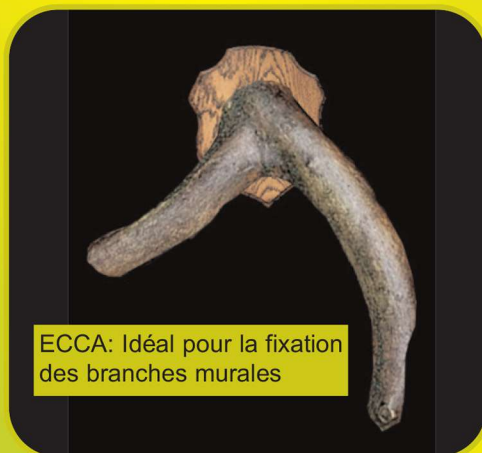
ECCA: Idéal pour la fixation des branches murales