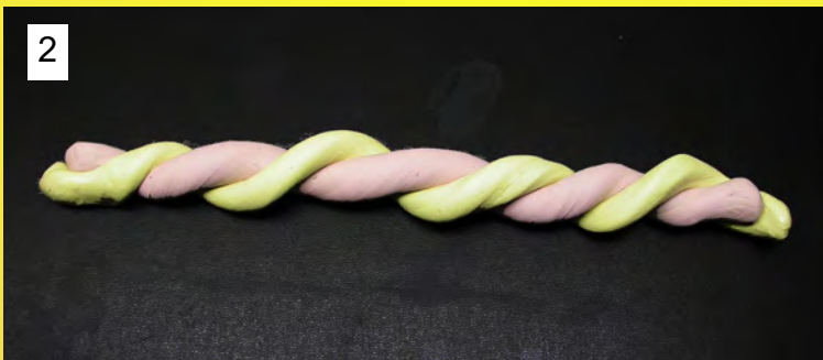
2 Rouler puis torsader les deux composants.