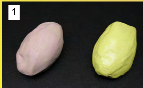
1 Prélever une partie de rose et une partie égale de jaune