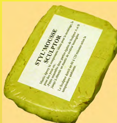
Produit fini de couleur chair