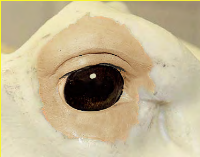
IDÉAL POUR LA POSE DES YEUX