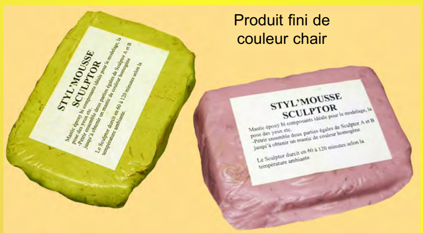
Produit fini de couleur chair