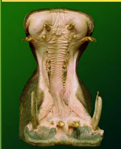
LE MODELAGE DES GUEULES OUVERTES

Manipuler le produit avec des gants en latex