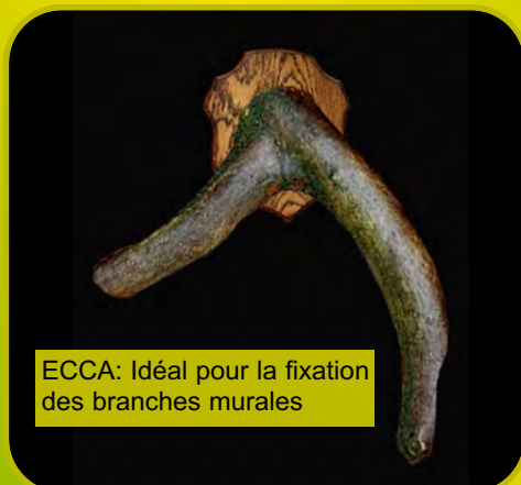
ECCA: Idéal pour la fixation des branches murales